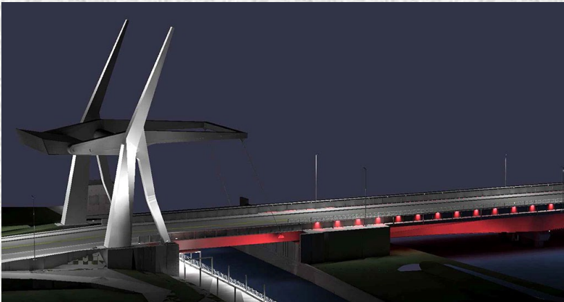
Pont Gouin inauguré fin 2019 (Saint-Jean-sur-Richelieu)

Association québécoise des directeurs et directrices d'établissement d'enseignement retraités