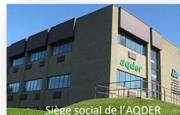
Siège social de l'AQDER

Le bureau de l'AQDER a réouvert ses portes le 15 août dernier, après la trêve estivale. Il vous est recommandé de communiquer avec Nancy Briand, par courriel de préférence ( info@aqder.ca ). La ligne téléphonique reste bien-sûr également disponible si vous privilégiez ce mode de communication au (514) 353 3254, pendant les heures de bureau, soit de 8 h à 15h30.