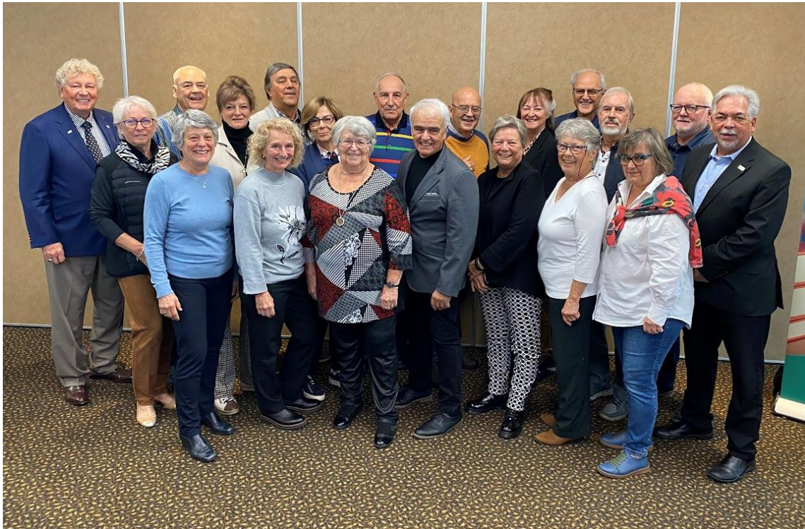
Photo prise à Drummondville lors du conseil des président(e)s d'octobre dernier