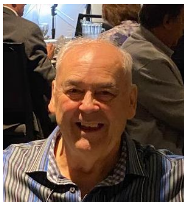
Par Clément Lemoine Trésorier de l'AQDER