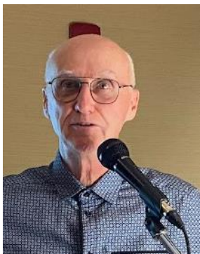
Par Claude Mayeu Vice-président de l'AQDER

Lors de notre dernier conseil des présidents d'octobre dernier, l'AQDER a honoré à sa soirée de la Reconnaissance quelques membres qui ont offert beaucoup de leur temps de retraité(e) aux services de l'AQDER.