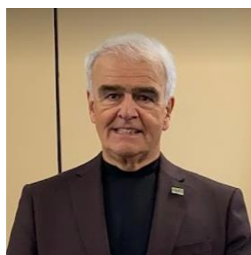
Par Michel Gobeil Président de l'AQDER